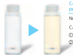
Colore dell'olio fresco di fabbrica Colore dell'olio dopo 10 anni d'uso

Usando il nuovo olio HAB il circuito frigorifero dura più a lungo in quanto è soggetto ad un deterioramento decisamente inferiore*